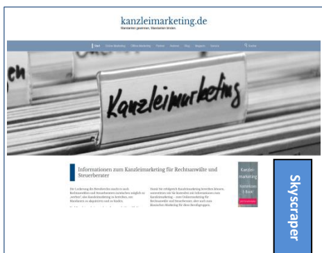
Skyscraper auf der Startseite Größe: 160 x 600 px, RGB Preis: € 1.200/Monat